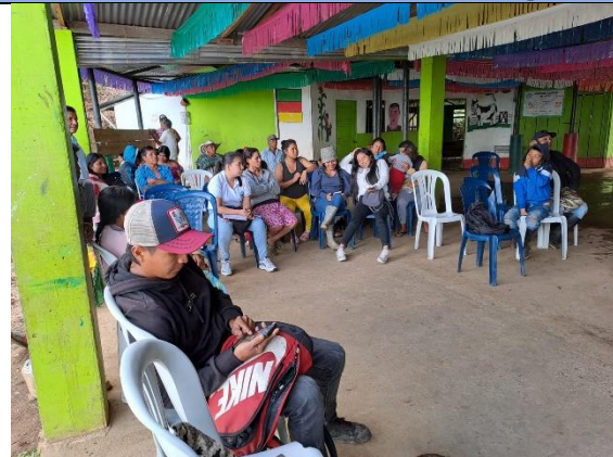
Actividad: Reunión con padres de familia