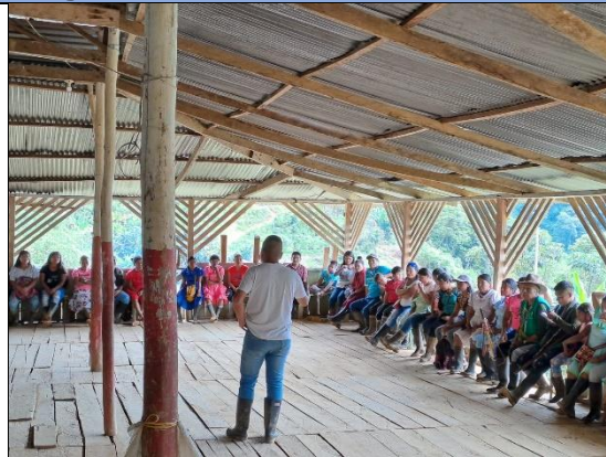
Actividad: Reunión con padres de familia

Lugar: Cañon del Rio Garrapatas El Dovia Valle