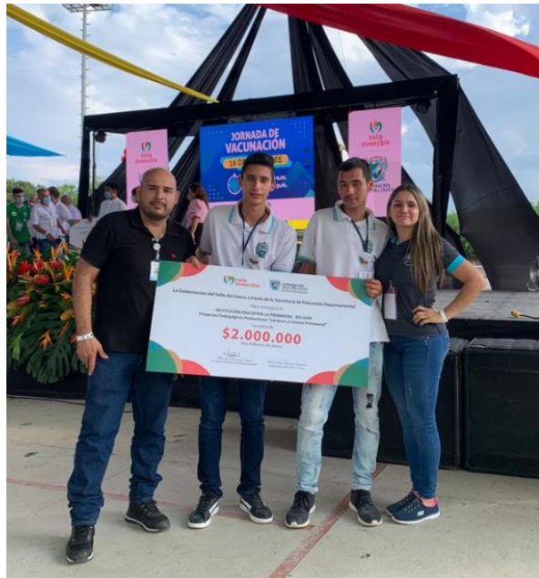
Actividad: Feria de Emprendimiento Lugar: Cali - Valle