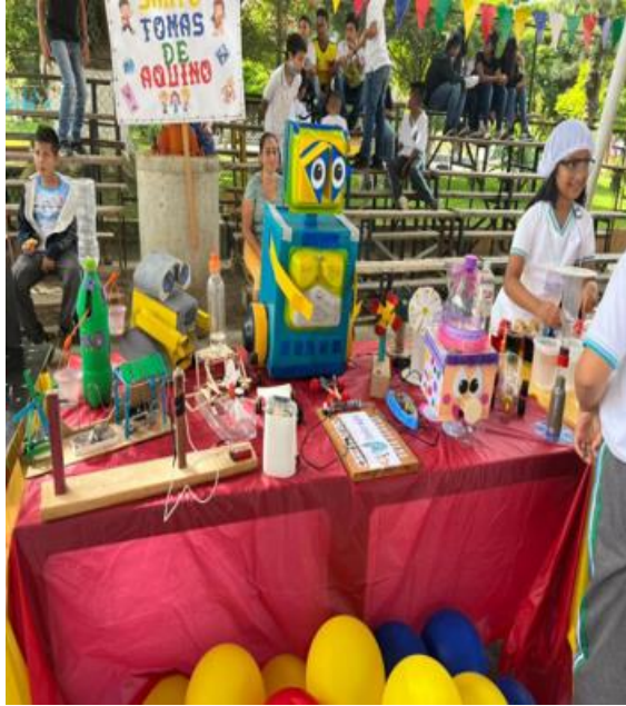
Actividad: Muestra Agroindustria Lugar: Parque Corregimiento Primavera