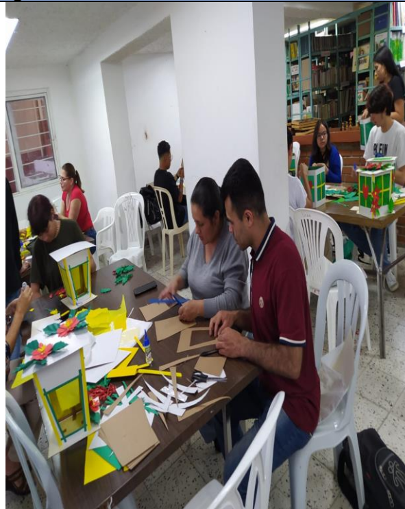
Actividad: Celebración día de la Independ.