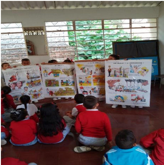
Actividad: SALA DE LECTURA Lugar: Sede Preescolar