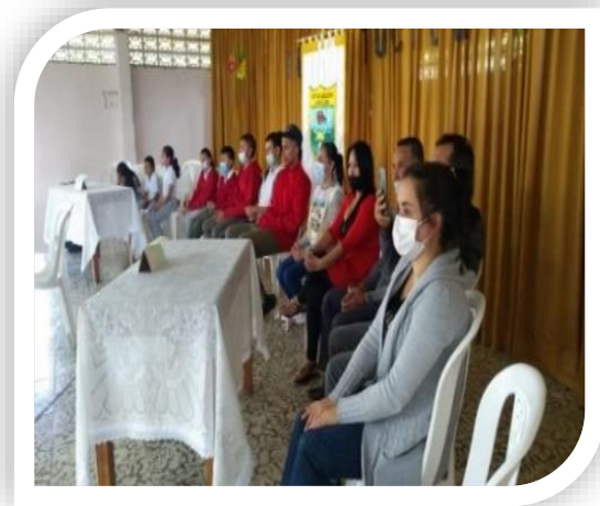
Actividad: POSESION GOBIERNO ESCOLAR Lugar: Sede principal "La Inmaculada"