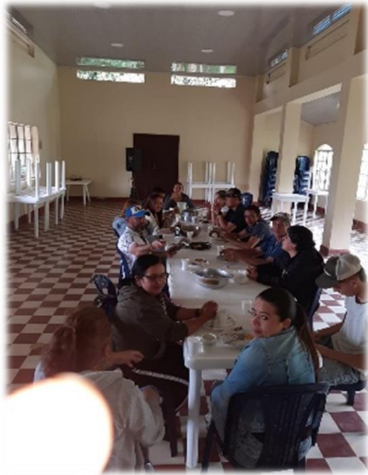
Actividad: ENCUENTRO DOCENTES Y ADMINISTRATIVOS