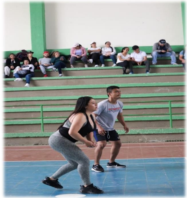
Actividad: ENCUENTRO DOCENTES Y ADMINISTRATIVOS