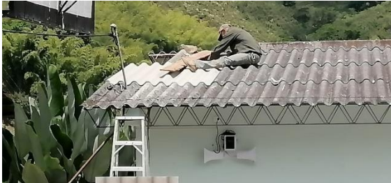
Actividad: Reparación techo biblioteca Lugar: Villarodas