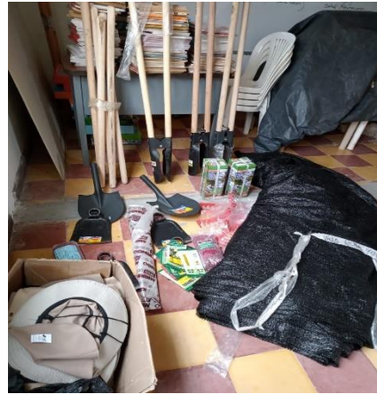
Actividad: Fundacion Biodess Lugar: Villarodas