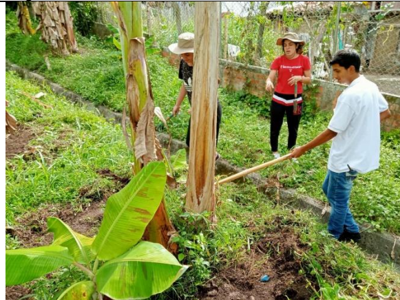
Actividad: Huertas escolares Lugar: IE Maria Analia Ortiz Hormaza