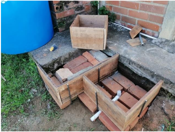
Actividad: Cosecha de aguas lluvias Lugar: Villarodas