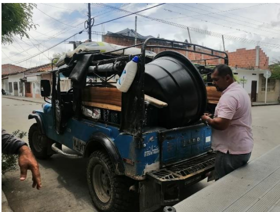
Actividad: Kit huertas escolares Lugar: Obando