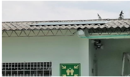
Actividad: Instalación panel solar Lugar: