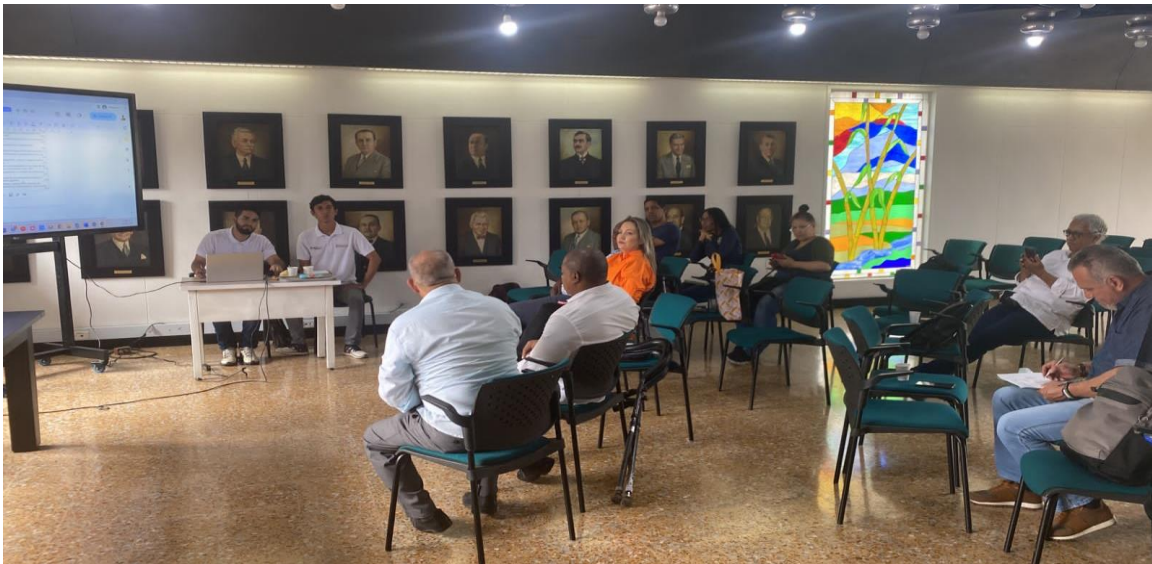
Evidencia Fotográfica: Mesa institucional