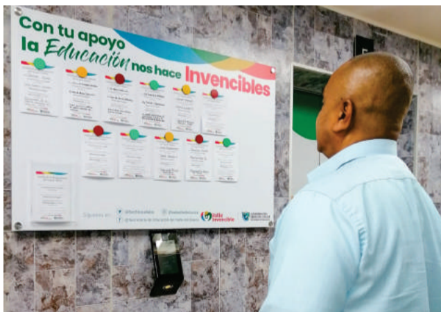
El Muro del Reconocimiento le apunta además a promover el sentido de pertenencia por la entidad.

La Secretaría de Educación del Valle implementó la estrategia organizacional 'El Muro del Reconocimiento' para exaltar y motivar a los equipos de trabajo a reconocer las gestiones que realizan sus compañeros en el proceso de gestión de la prestación del servicio educativo.