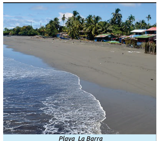
Playa La Barra

Si buscas jardines tropicales, cascadas de agua dulce, una hermosa playa y atardeceres de ensueño, Juan de Dios será tu