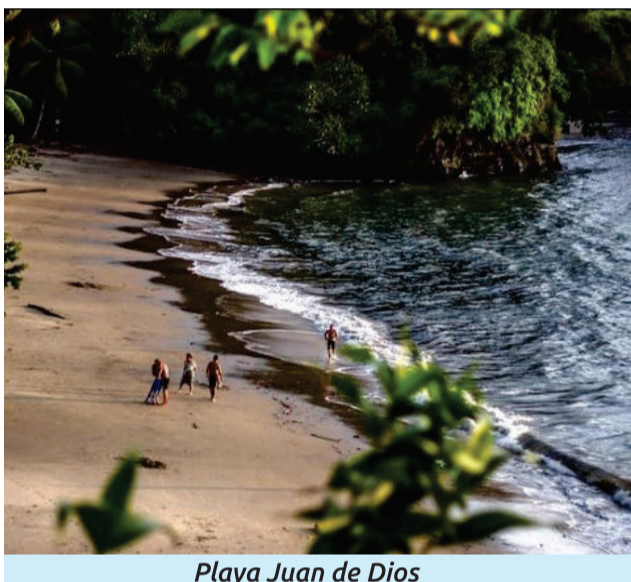
Playa Juan de Dios

Magüipi es la primera playa de Colombia certificada con Bandera Azul' por la práctica del turismo sostenible. Ubicada a 30 minutos en lancha desde Buenaventura, es un destino imperdible para, además de disfrutar del mar, realizar caminatas turísticas, visitar piscinas de agua dulce y conocer los manglares a bordo de kayaks.