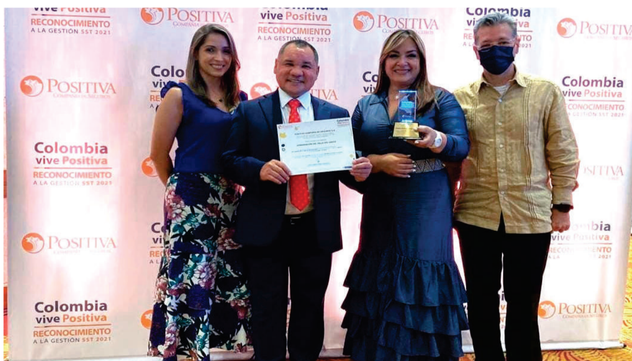
El Equipo de Seguridad y Salud en el Trabajo de la Gobernación estuvo presente durante la ceremonia de entrega del reconocimiento Colombia Positiva.

Camilo Gómez Cristancho, vicepresidente de Promoción y Prevención de Positiva, reconoció el compromiso, esfuerzo, dedicación y capacidad de la Gobernación y las demás entidades descentralizadas para afrontar los cambios del entorno, las buenas prácticas en Seguridad y Salud en el Trabajo y capacidad de respuesta ante la pandemia.