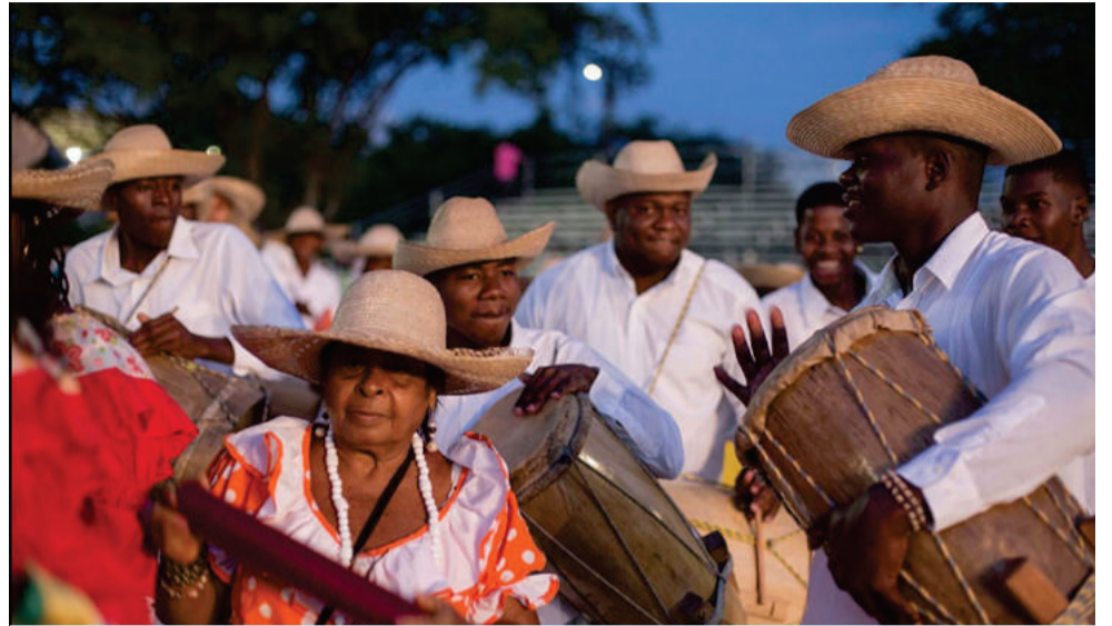
Los encantadores ritmos del pacífico son el deleite de propios y turistas.

Semana Santa es tiempo de reflexión y también de descanso, y el pacífico vallecaucano es el escenario perfecto. Con su riqueza cultural ancestral, gastronomía, hermosos paisajes, su gran biodiversidad y sus hermosas playas, el litoral es el destino perfecto para los días de descanso.