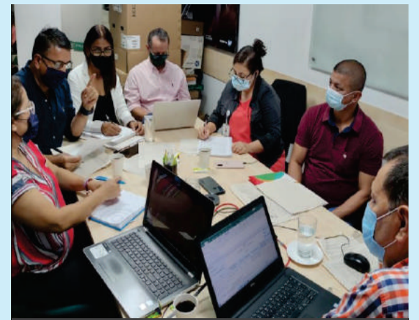
Grupo GESCO del Departamento Administrativo de Hacienda y Finanzas

El ejercicio se realizará periódicamente, con el fin de incentivar al personal de la dependencia a seguir trabajando comprometidos por la comunidad educativa del departamento.