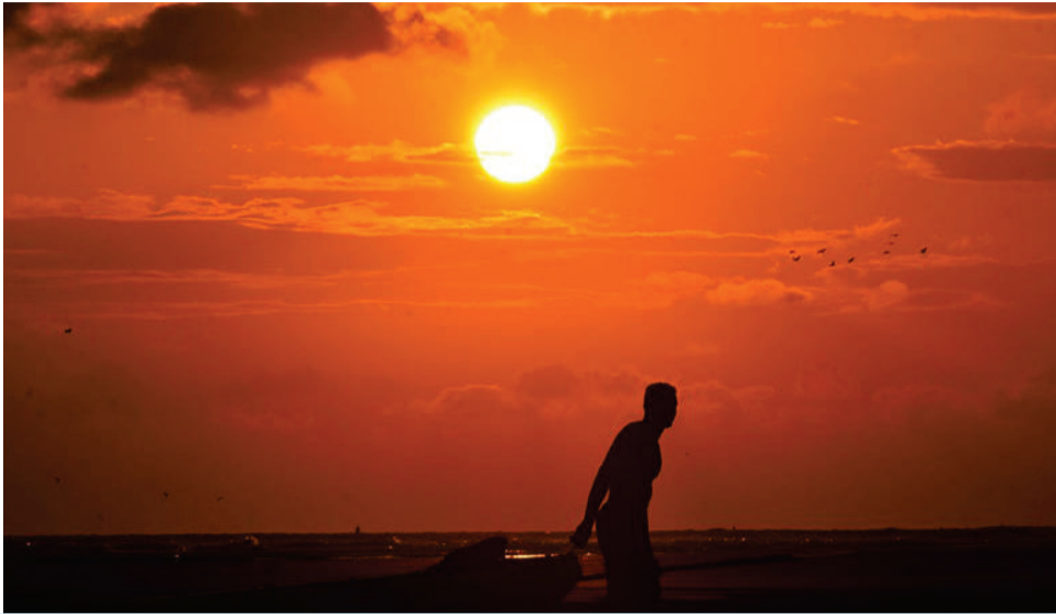
Los hermosos atardeceres hacen parte de la mágica experiencia del Pacífico vallecaucano.