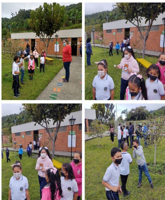
Actividad: Plan de gestión del riesgo