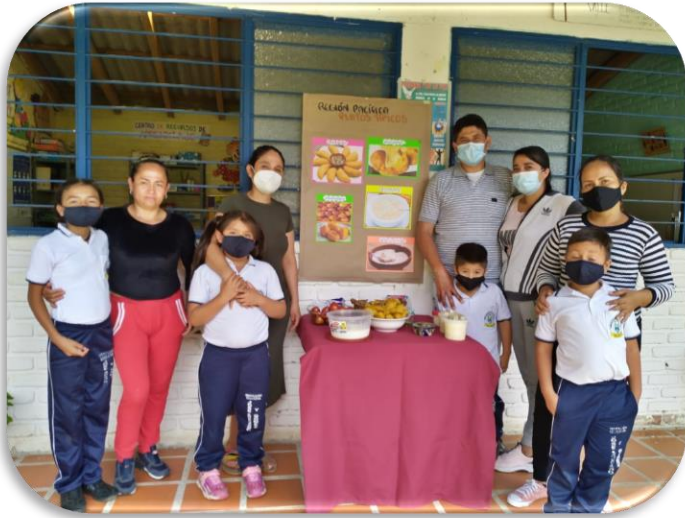
Semana por la paz,