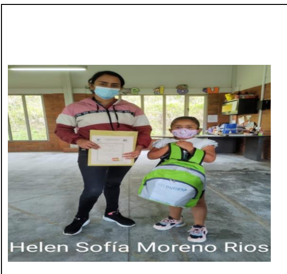
Actividad: Entrega KIT NUTRESA