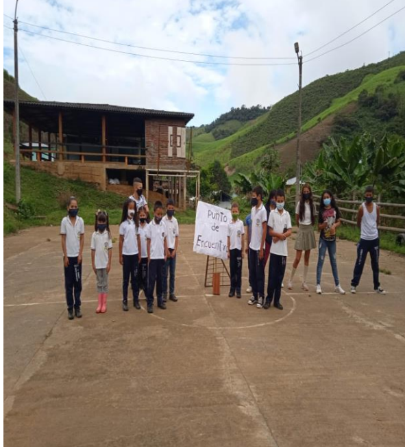
Actividad: Plan de gestión del riesgo