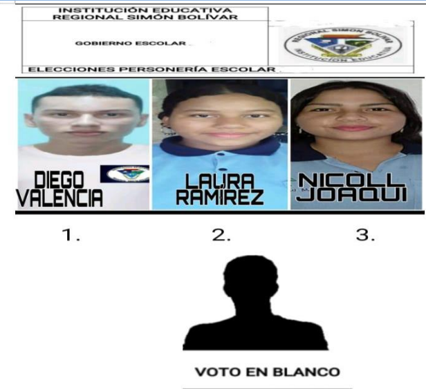
Actividad: Elección Personero Estudiantil Lugar: Regional Simón Bolívar