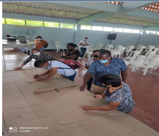
Actividad: Escuela de Padres Lugar: Regional Simón Bolívar