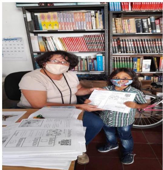
Actividad: Entrega de guías pedagógicas