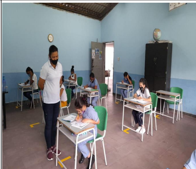
Actividad: Evaluación Pruebas Saber Valle