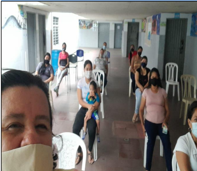
Actividad: Asamblea de padres de familia Lugar: Regional Simón Bolívar