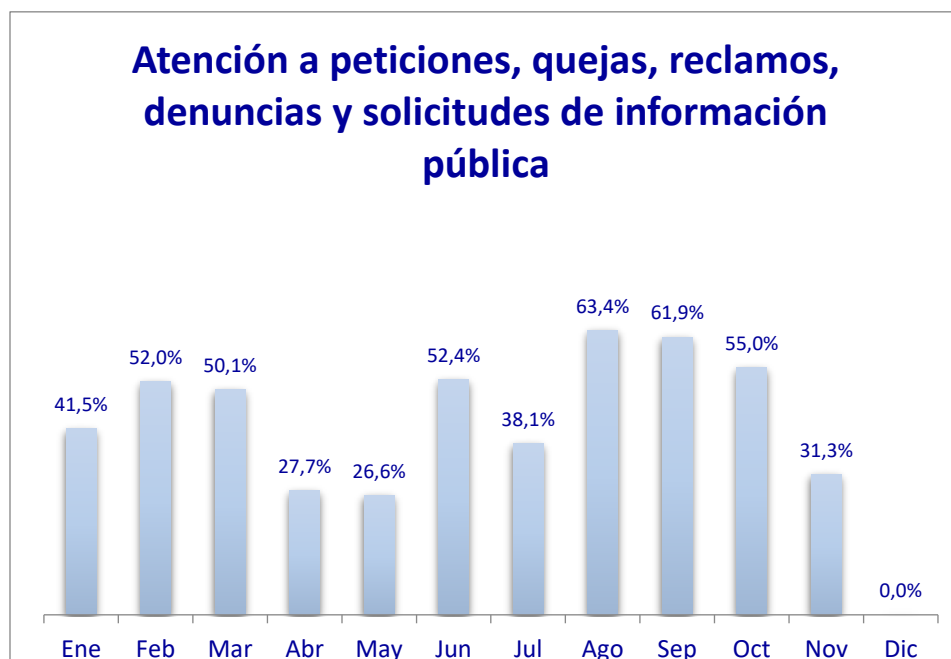
Gráfico 1: Porcentaje mensual de radicados SADE y PQRS respondidos por la Secretaria de Educación

En la Tabla 12 se visualiza mes a mes los radicados ingresados a la Secretaria de Educación, comparados con los respondidos en el mismo mes, y el % de Ejecución que para el caso de noviembre fue del 31.26%, aclarando que los radicados se vencen de acuerdo a la fecha de radicación y los términos de Ley.