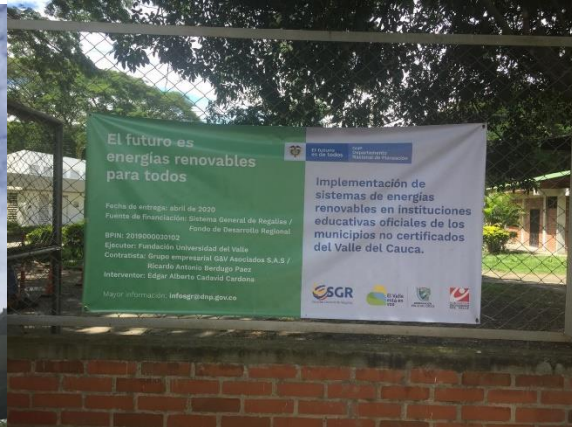
Institución Educativa Simón Bolívar