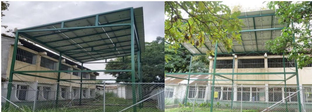
Institución Educativa Francisco Antonio Zea