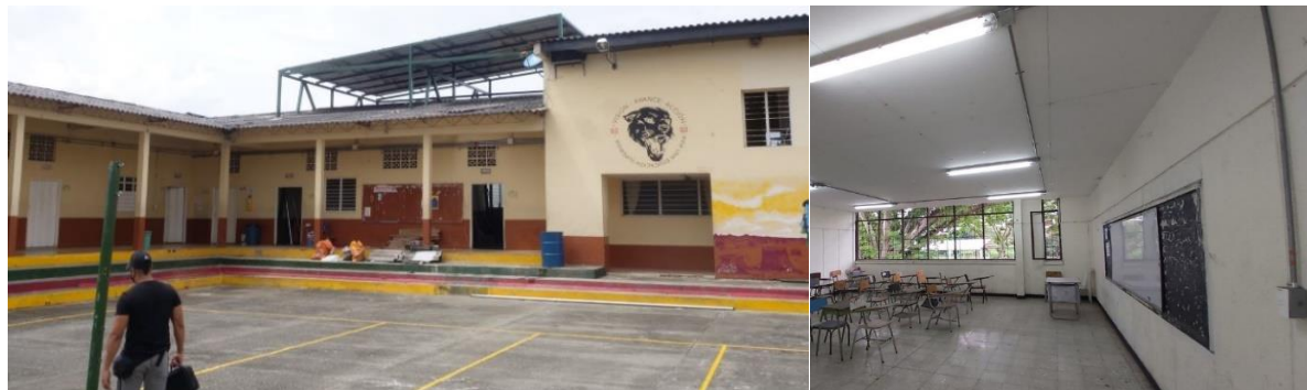
Institución Educativa Liceo Mixto