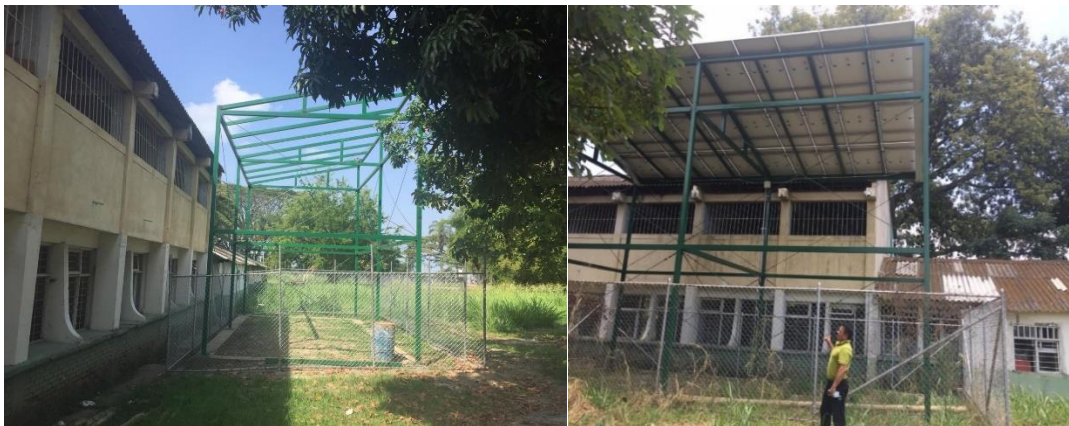
Institución Educativa Francisco Antonio Zea