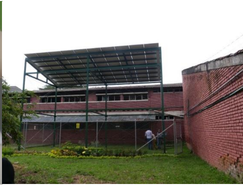
Institución Educativa Normal Superior Jorge Isaac