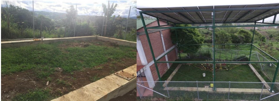
Institución Educativa Borrero Ayerbe – Km 30 Dagua