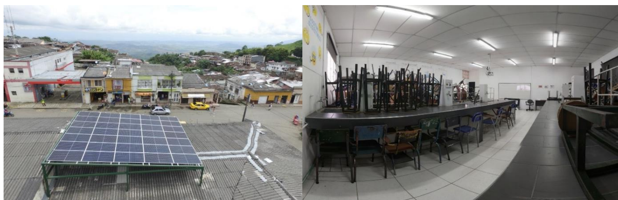
Institución Educativa Liceo Mixto