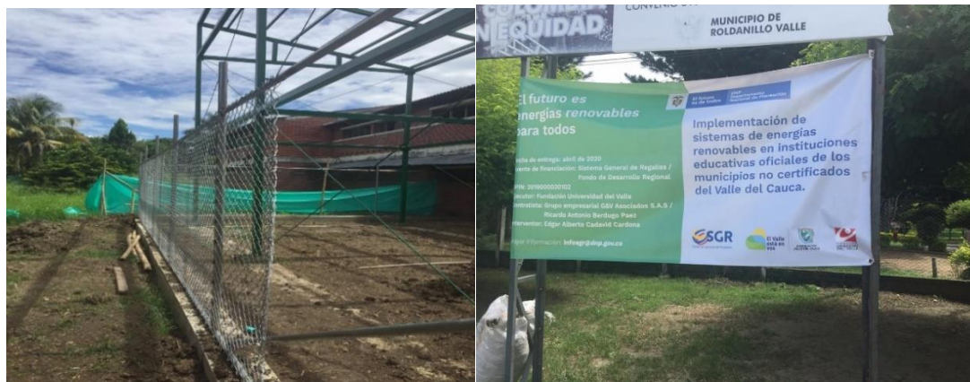
Institución Educativa Normal Superior Jorge Isaac