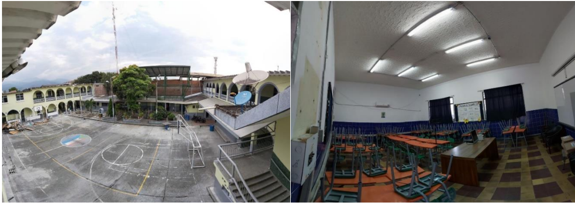
Institución Educativa Las Américas