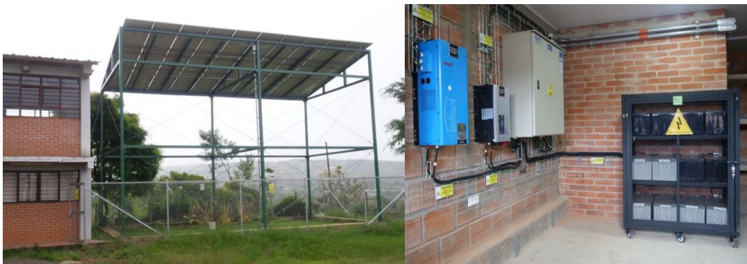
Institución Educativa Borrero Ayerbe – Km 30 Dagua