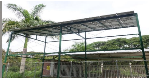
Institución Educativa Simón Bolívar