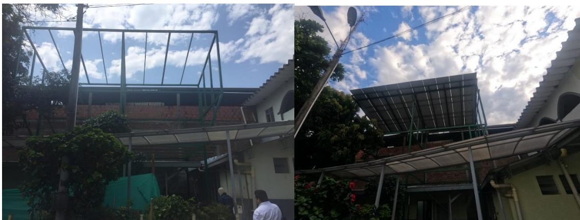
Institución Educativa Las Américas