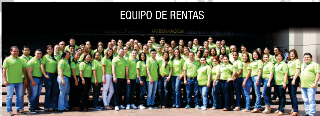
EQUIPO DE RENTAS