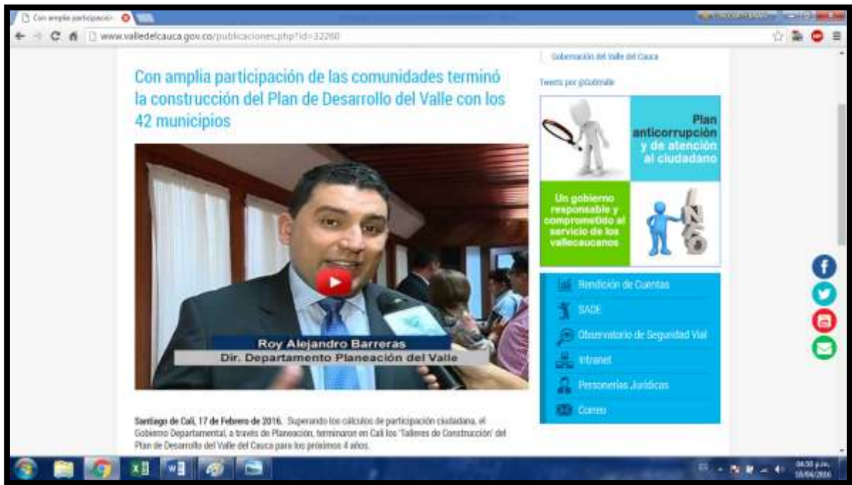
Figura 7. Publicidad Web Talleres de Participación en la construcción del Plan de Desarrollo 2016-2019.

Fuente: Departamento Administrativo de Planeación Departamental del Valle del Cauca.