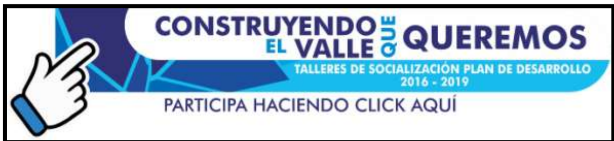
Figura 6. Publicidad Web Talleres de Socialización del Plan de Desarrollo.

Fuente: Departamento Administrativo de Planeación Departamental del Valle del Cauca.