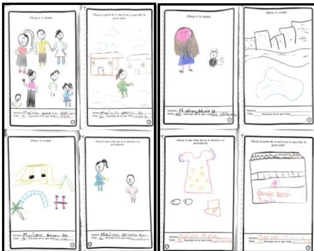
Figura 3. Taller de Participación Subregional para la construcción del Plan de Desarrollo 2016-2019, realizado en el municipio de Sevilla, el día 11 de febrero de 2016

Fuente: Departamento Administrativo de Planeación Departamental del Valle del Cauca.