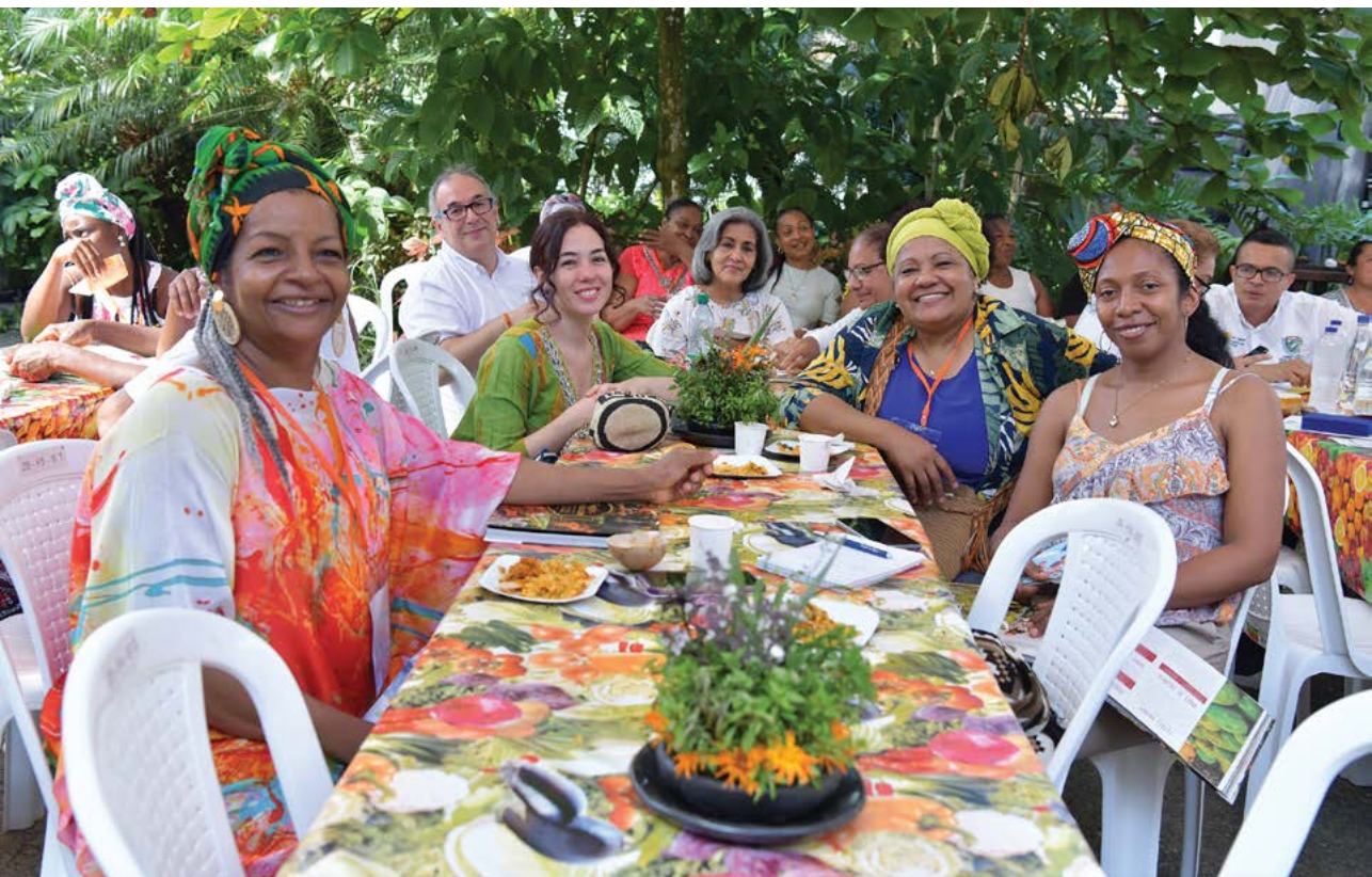
Asistentes al Encuentro