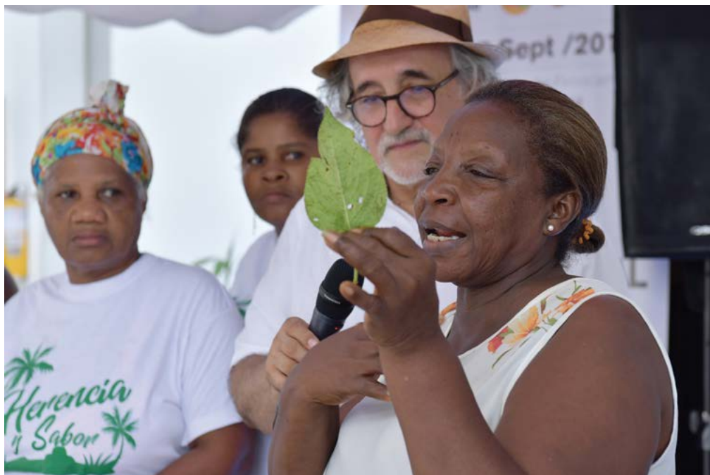
Ofrecimiento de la bebida venturosa por parte del corregimiento número 8

La comunidad del corregimiento 8 ofreció a los asistentes una bebida refrescante de venturosa, una planta de la familia de las verbenaceae de uso medicinal.